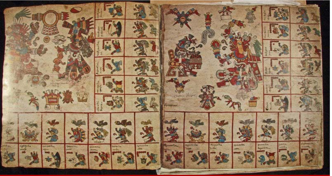
Rupelek ji Pirtukên Pîktoral a Aztec, arşîv

Di sala 1492ê de, Antonio de Nebrija, humanîst û zimanzanekî îspanyolî, pirtûka xwe ya li ser gramera zimanê Kastilyayê qedand û îthafî Keybanuya Îspanyayê Isabella kir. Pirtûk di nav zimanên Ewropî de yekemîn pirtûka gramere bû. Nebrija, di pêşgotinê de hêviya xwe jî eşkere kir: “Zimanê Kastilyayê dê bibe nîşana împatoriya cîhanê ku hêvîdar e ku Îspanyayê ava bike.” Û piştê dustûra humanîstê îtalî Lorenzo Valla ya “ziman her tim hevrêyê împatoriye bû” daxilî ithafa xwe ya bo Keybanû Isabella kir.