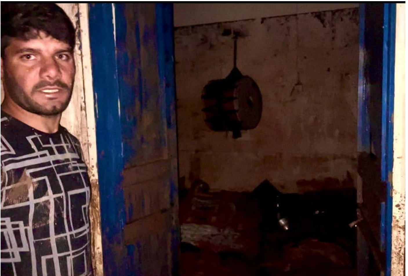
Mexdûrên lehîyê bi piranî li Eyubîye û Halîlîye ne ku her du jî li merkeza Riha ne.