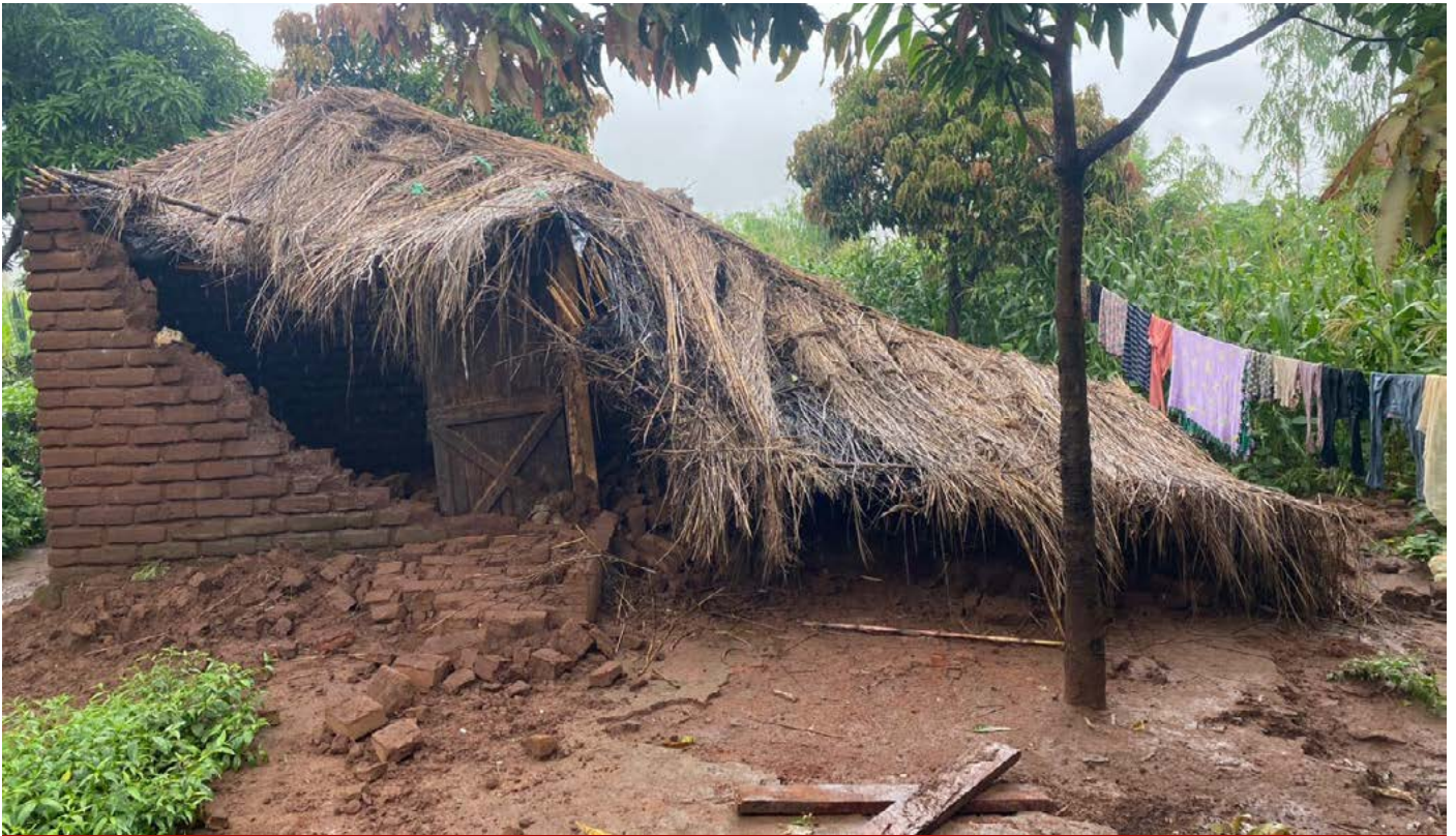
Gundê Julia li parêzgeha Zomba ya Malawî

Bohaza Freddyê li parzemîna Afrîkayê tesir kir. Ji ber barana zêde li Malawî û Mozambîkê bi hezaran xanî di nava lehîyê de man.