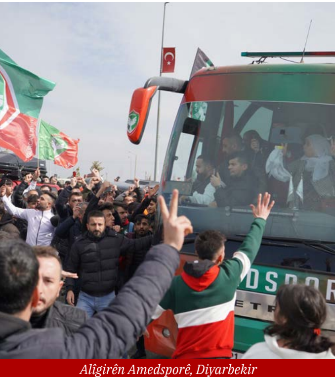
Aligirên Amedsporê, Diyarbekir

📖 İnan Eroglu 📄 Murat Bayram 📅 14. 03.2023