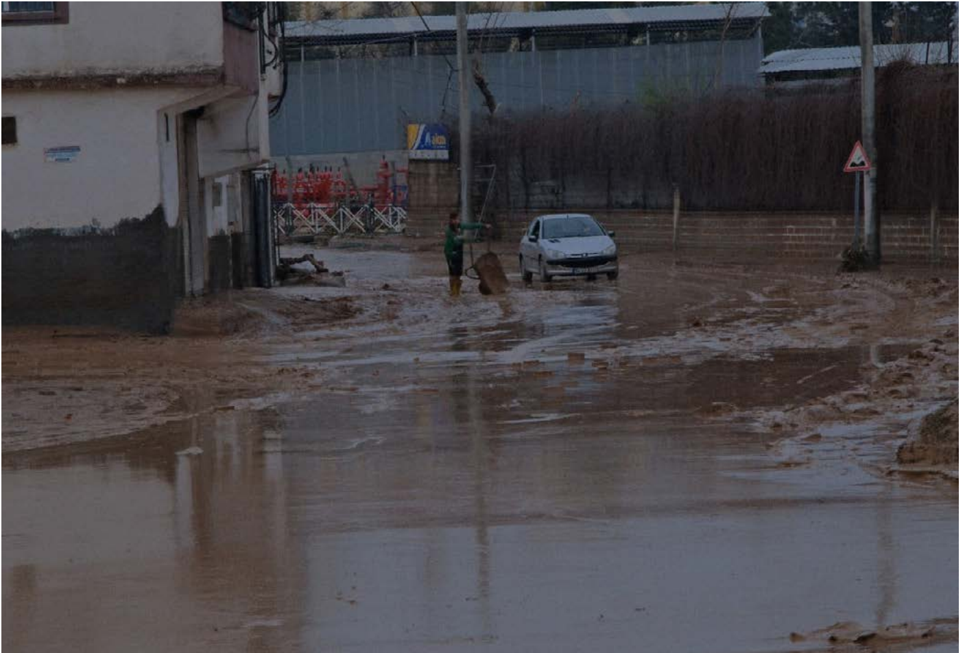
Ji wan zarokan yek ji hindur malê avê derdixe û li zîqaqê ro dike.