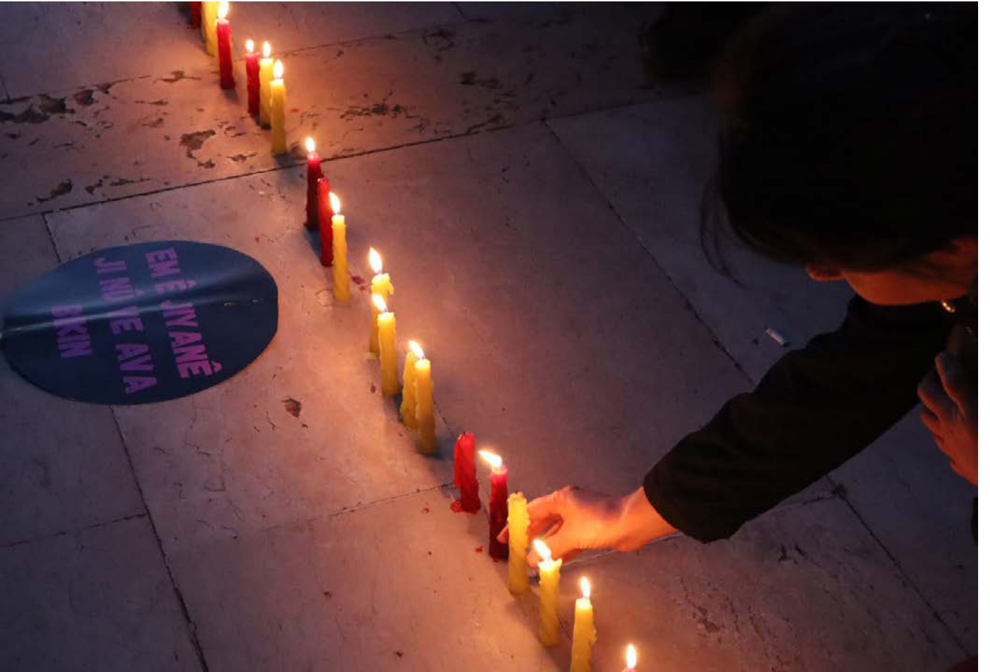
Di çalakîyê de jinên hatine qetilkirin bi mûman hatin bi bîr anîn.