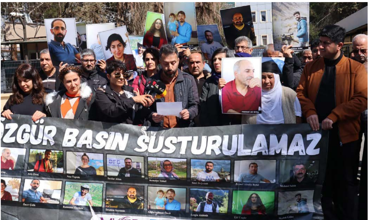
Daxuyaniya rojnamegeran ya li ber Edliyaya Amedê

Wêneyên rojnamegerên girtî rakirin û daxwaza azadiya hevalên xwe kirin.