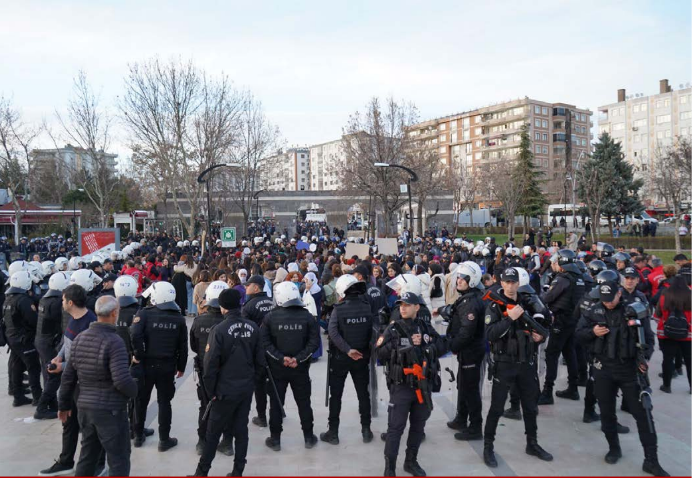
Çalakîya jinan di bin dorpêça polîsan de pêk hat.