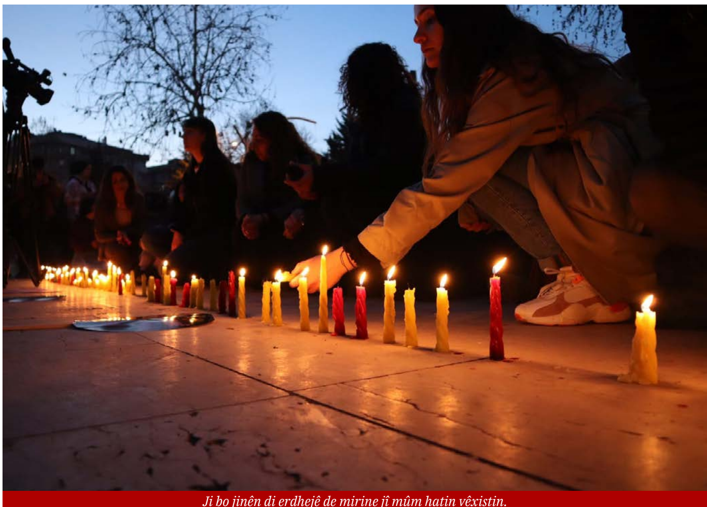
Ji bo jinên di erdhejê de mirine jî mûm hatin vêxistin.