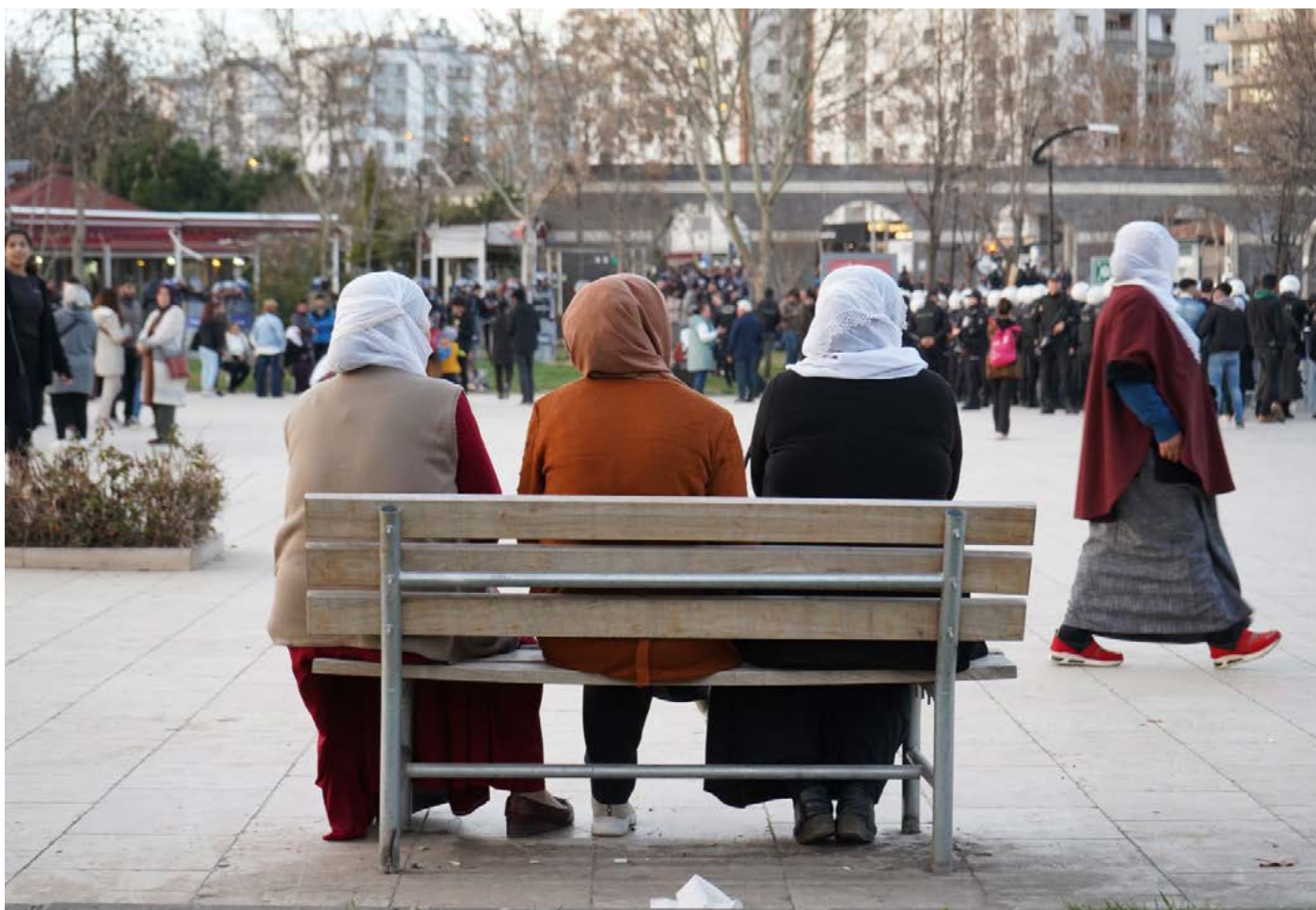
Hinek jin jî neketin nav dorpêça polîsan û çalaki jî dûr ve temaşê kirin.