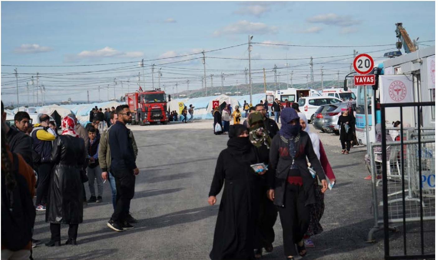
Kampa Mexdûrên Erdhêjê – Diyarbekir