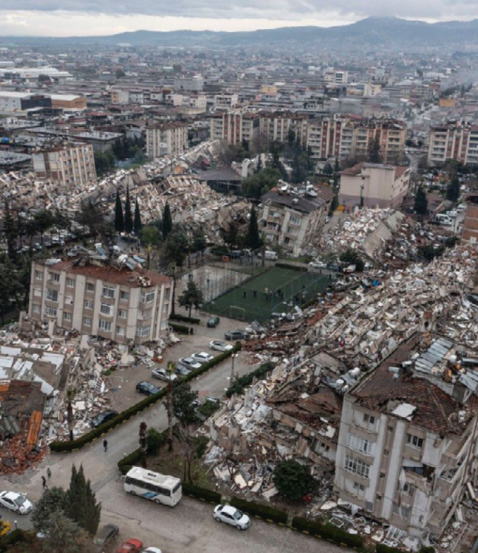
Piştî erdhêjê Hatay

Gulistan Korban 📅 Sibat 13, 2023