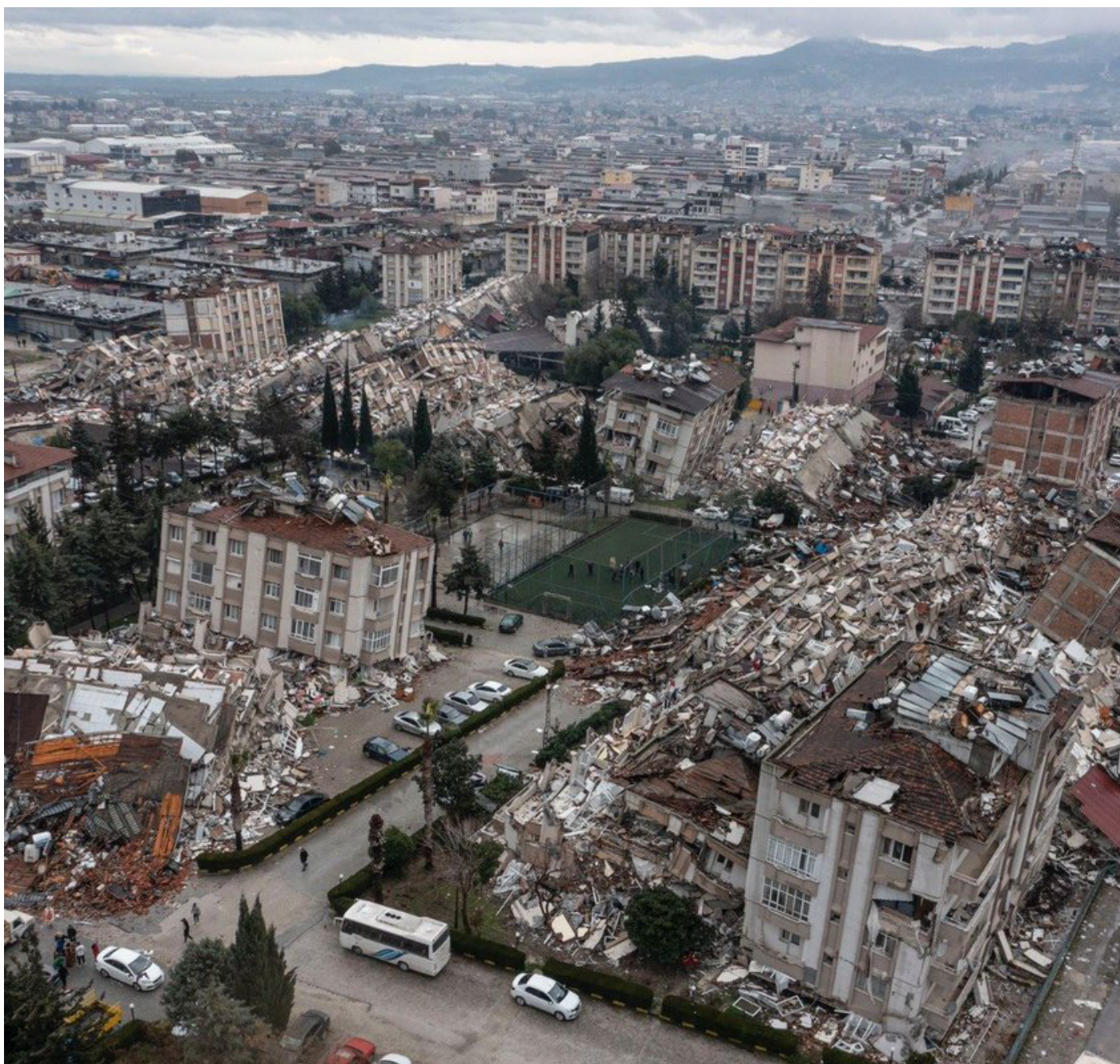
Piştî erdhêjê li Amedê yek ji avahiyên ruxiyayî-Diyar Galeria

Wezîrê bajarvaniyê diyar dike ku piştî erdhêjê heta niha li 10 parêzgehan 171 hezar û 882 avahî hatine lekolîn kirin.