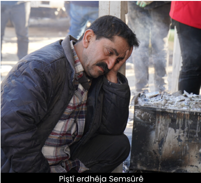
Piştî erdhêja Semsûrê

Gulistan Korban Murat Bayram Sibat 15, 2023