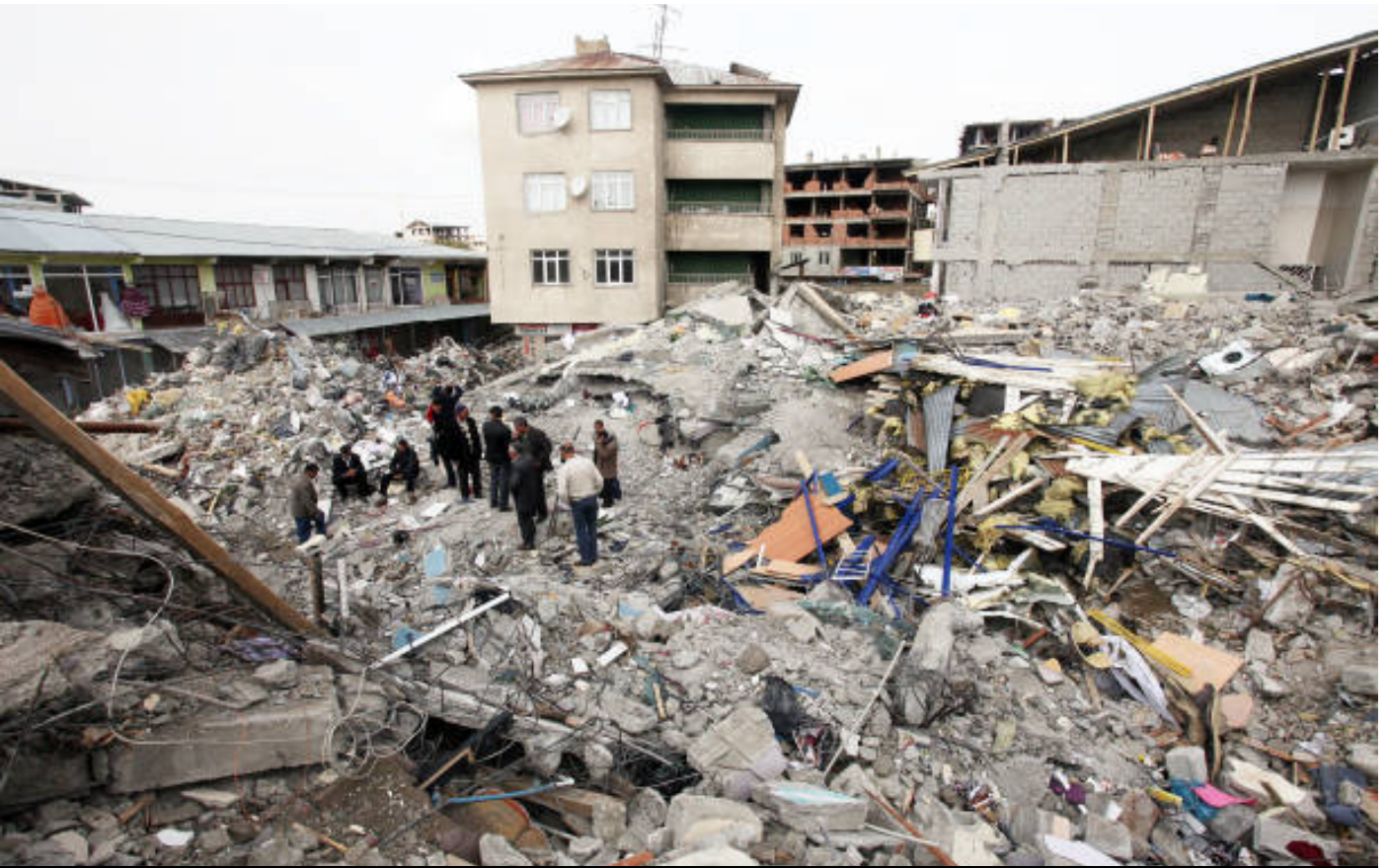
Arşiv: Erdhêja Wanê, 2011