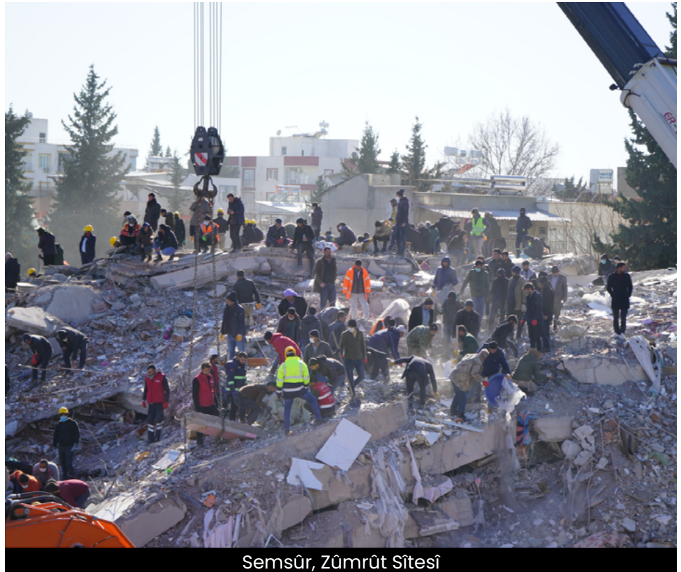
Semsûr, Zûmrût Sîtesî