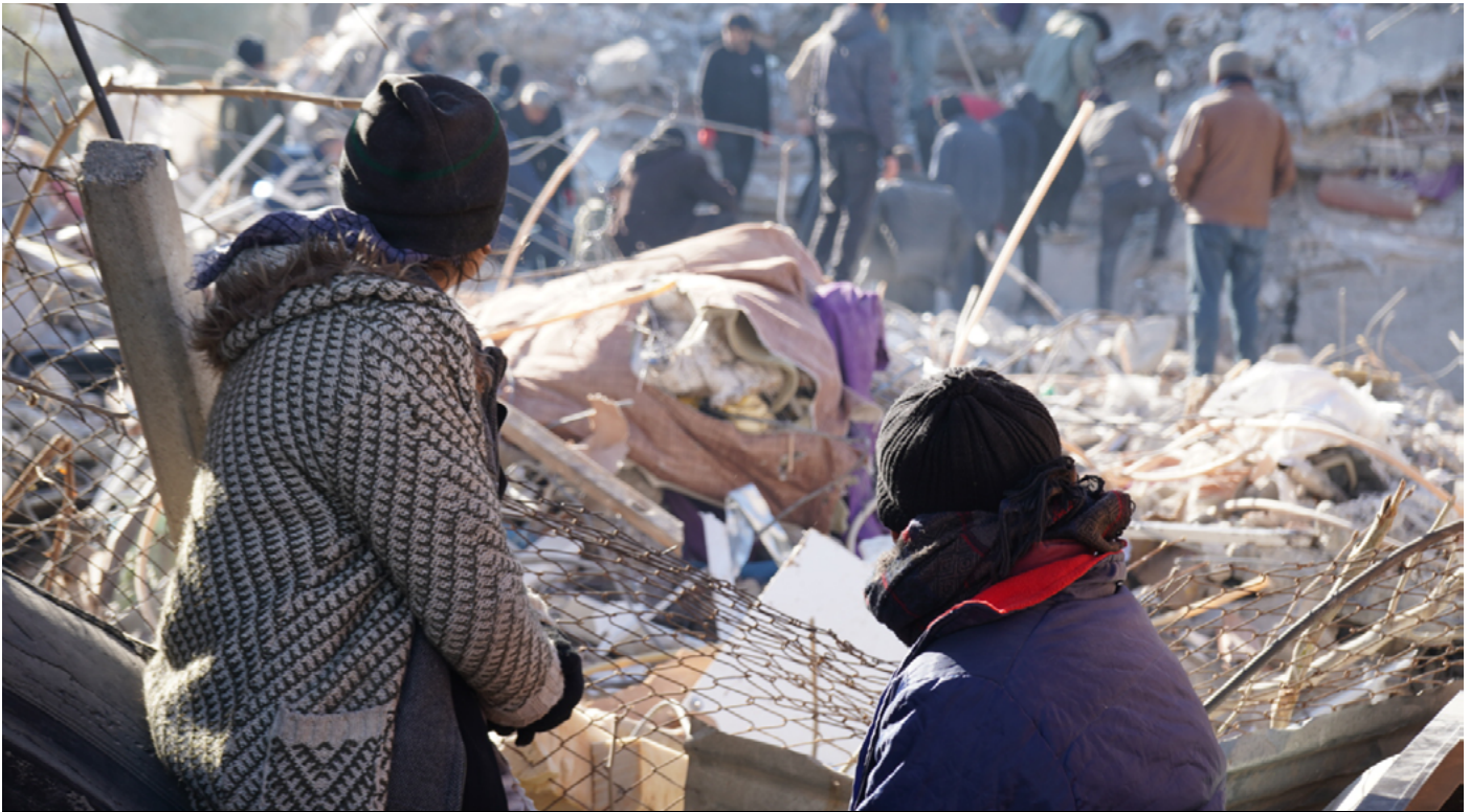
Semsûr, welatîyên li ser kavilekê li benda dîtina mirovên xwe

Piştî erdhêja bi pileya 7.7ê ya li Mereşê jimara miriyan bûye 31 hezar û 643 . Hêj bi jimareka nediyar kes li bin kavilan mane.